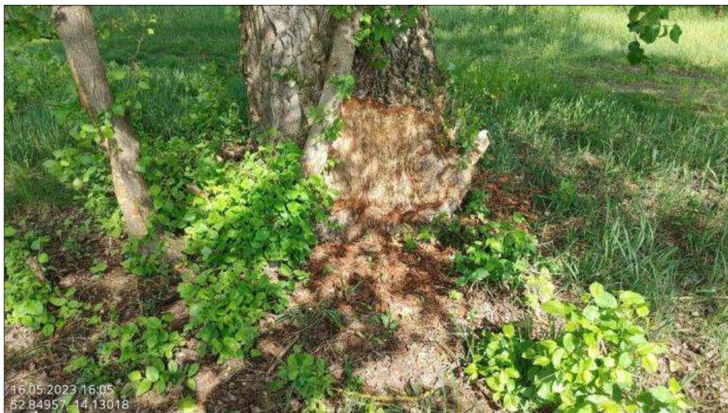
Fot. 20 Przykładowe ślady żerowania (zgryzy bobrowe) bobra Castor fiber w sąsiedztwie dalbowiska Kunice po zakończeniu inwestycji Osinów Dolny