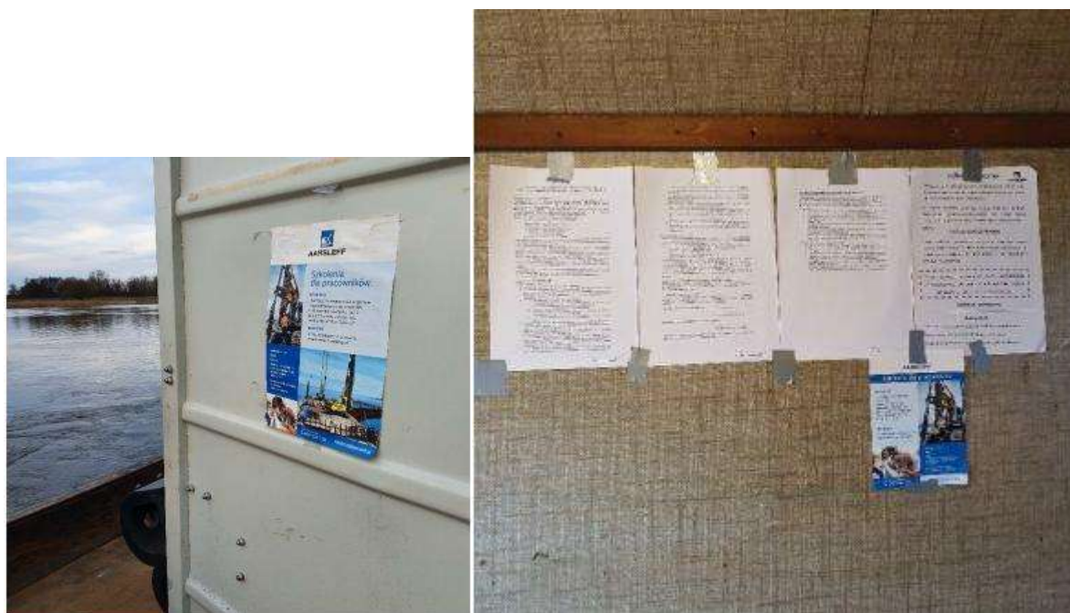
Fot. 10 Ulotki informacyjne na jednostkach pływających