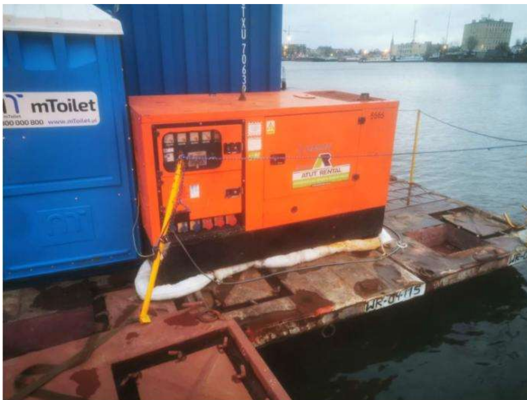
Fot. 9 Agregat prądowórczy z dodatkowym zabezpieczeniem przeciwrozlewowym na jednostce pływającej