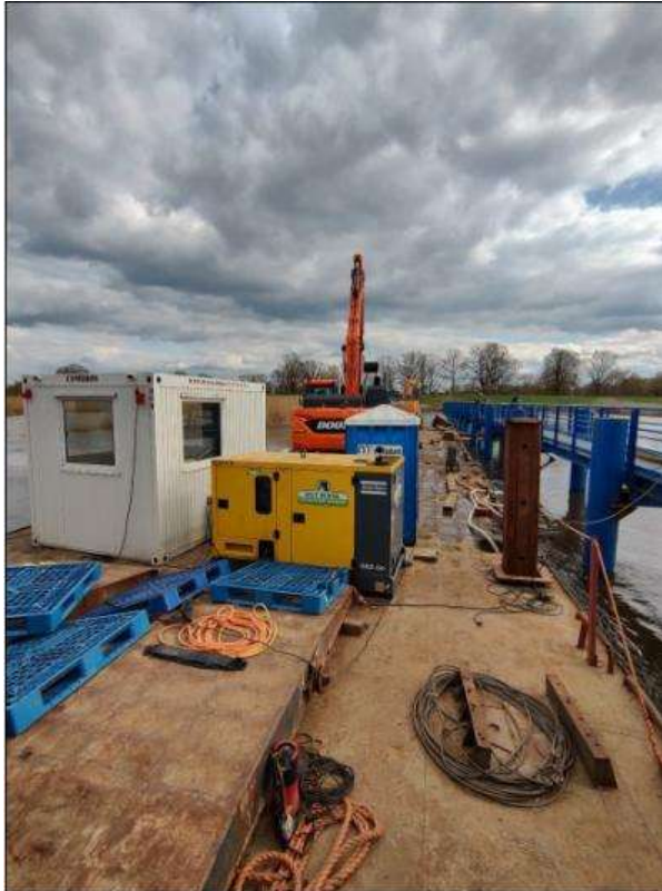
Fot. 7 Zaplecze budowy na jednostce pływającej – lokalizacja Pławidło