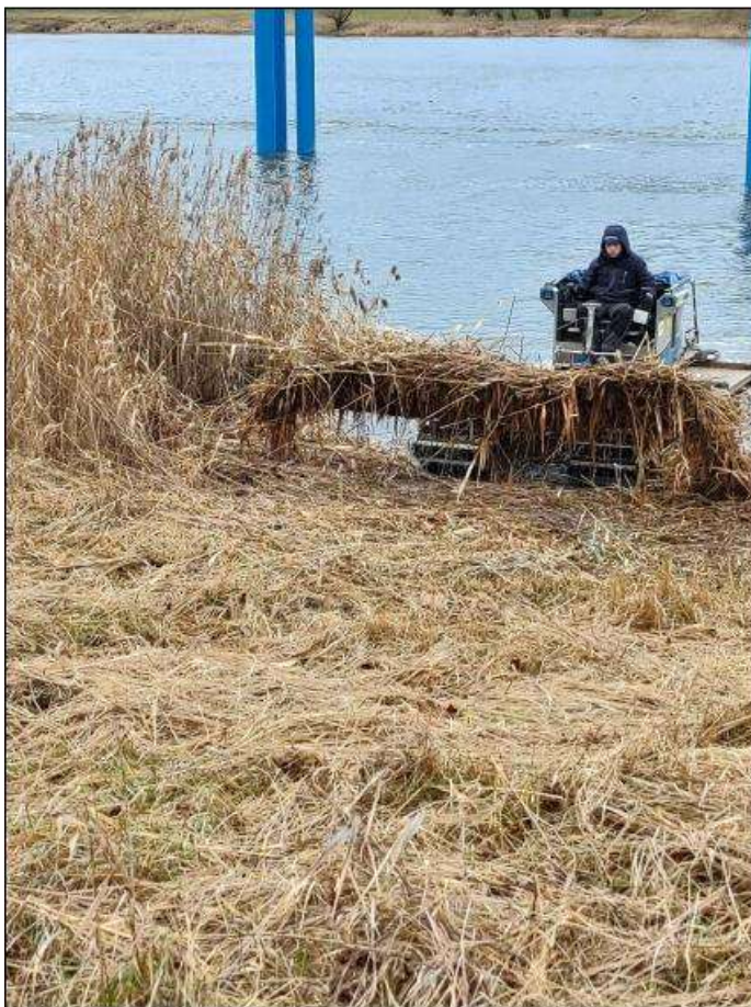
Fot. 6 Wycinka szuwarów – lokalizacja Osinów Dolny