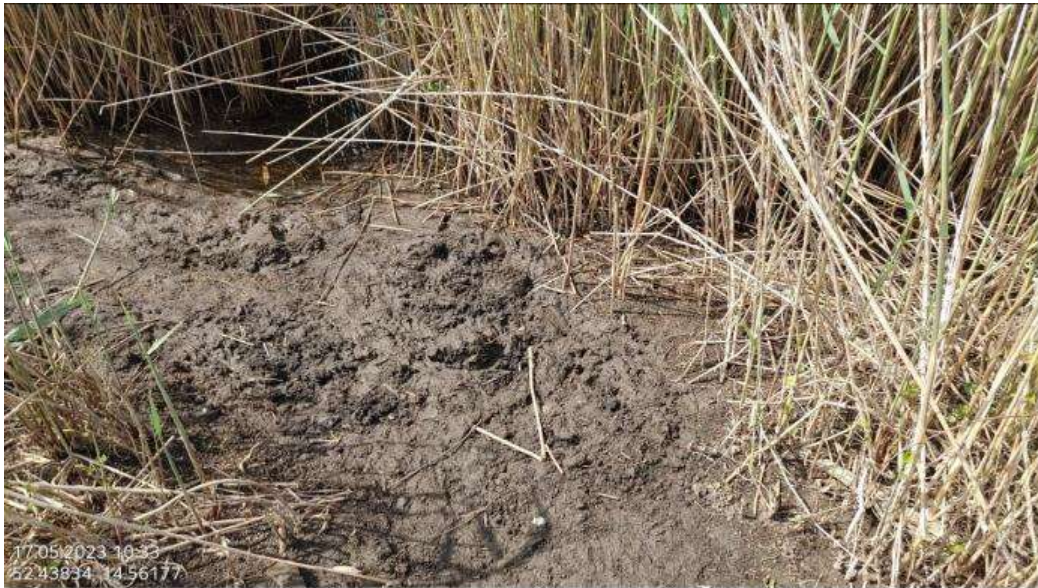
Fot. 19 Przykładowe ślady bytowania (kopic zapachowy) bobra Castor fiber w sąsiedztwie dalbowiska Kunice po zakończeniu inwestycji