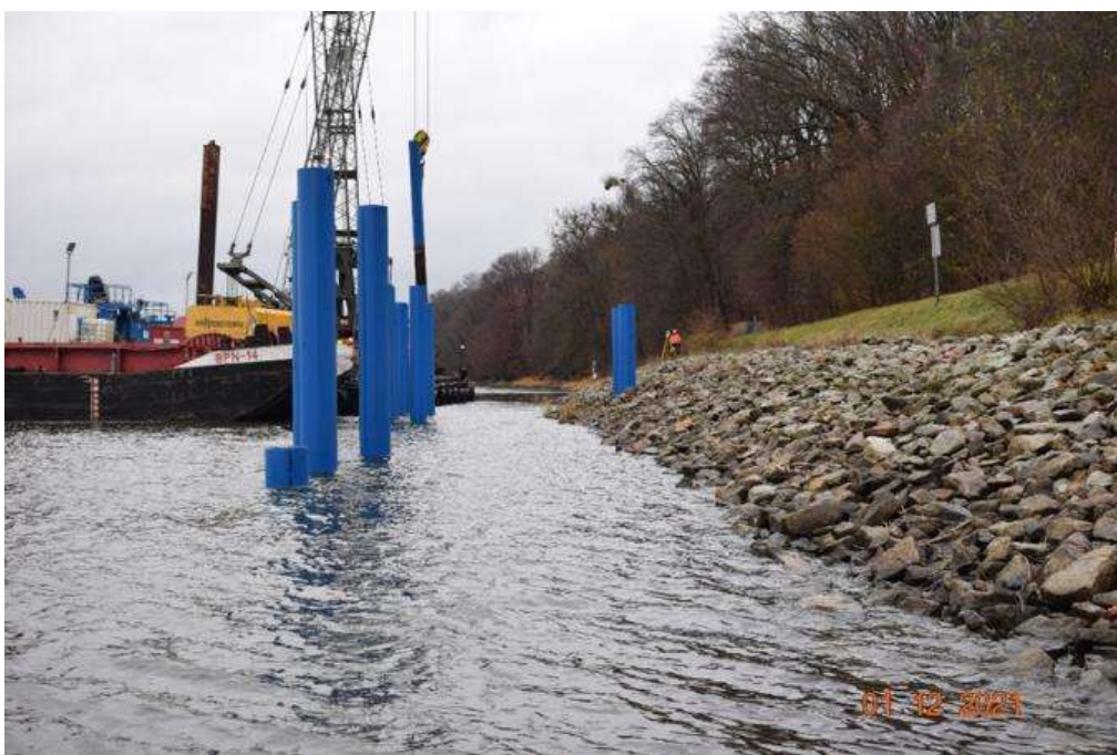
Fot. 4 Prace z wody w lokalizacji Zatoń Dolna