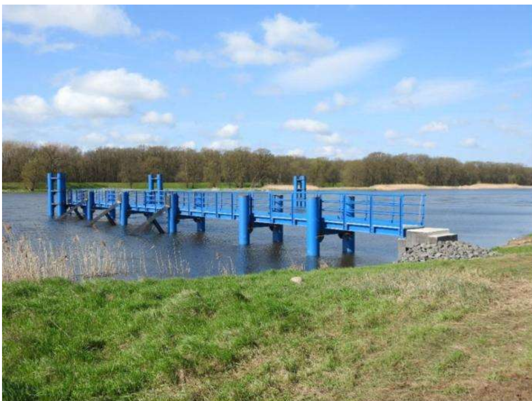
Fot. 18 Widok na dalbowisko – lokalizacja Kunice