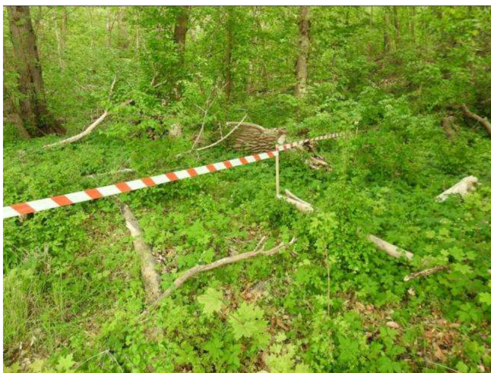
Fot. 2. Zabezpieczony płat siedliska przyrodniczego – łęg 91E0