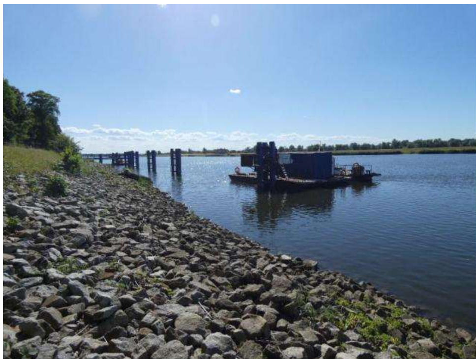
Fot. 1. Prowadzenie prac z wody – lokalizacja Zatoń Dolna