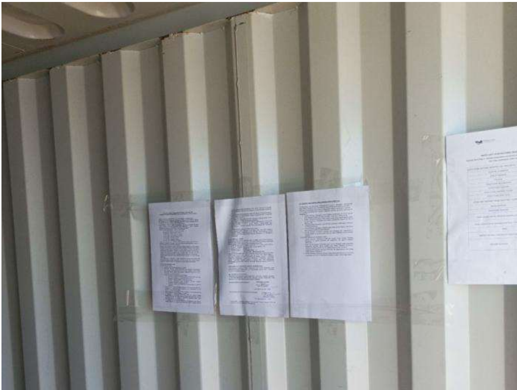
Fot. 8 Udostępniony dla pracowników Kodeks ES oraz lista BIOZ