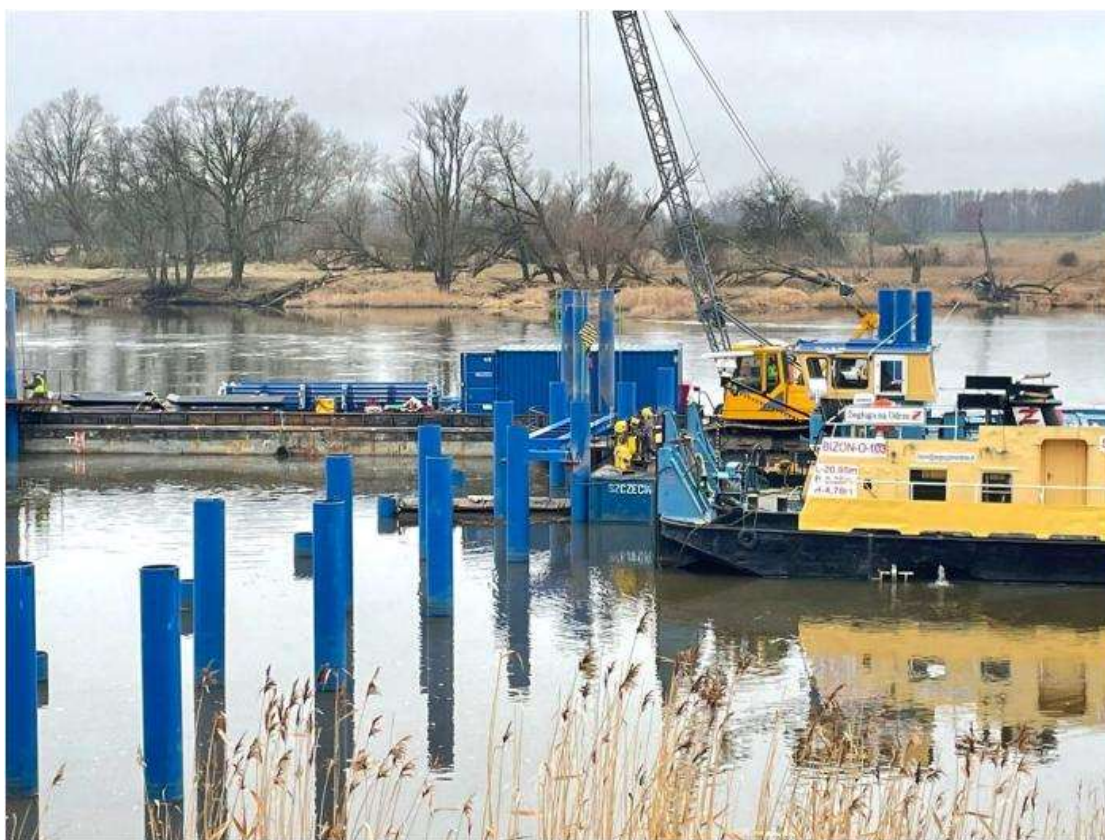
Fot. 12 Montaż pomostu – Ługi Górzyckie