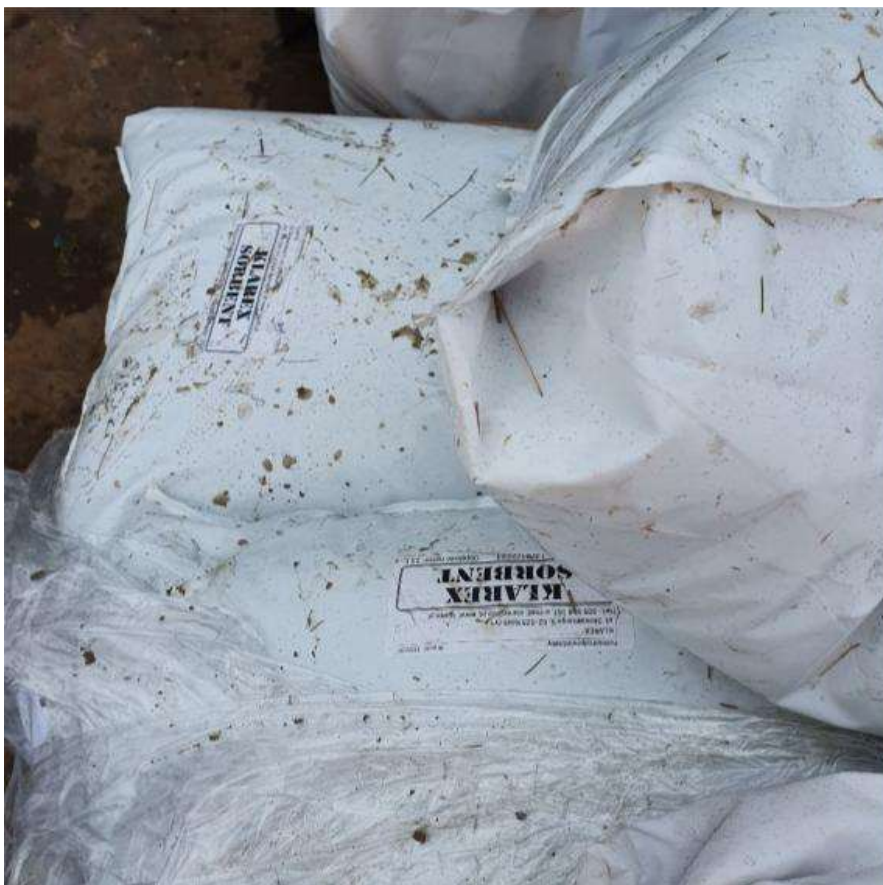
Fot. 14 Przygotowane sorbenty na jednostce pływającej