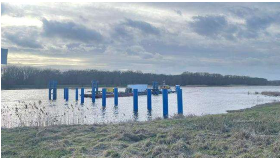
Fot. 15 Wykonane dalbowisko – lokalizacja Kunice