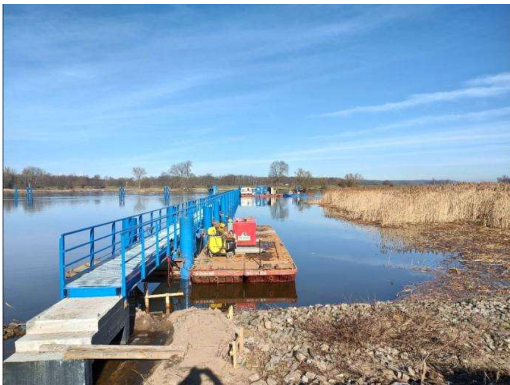
Fot. 17 Prowadzenie prac z wody – Pławidło