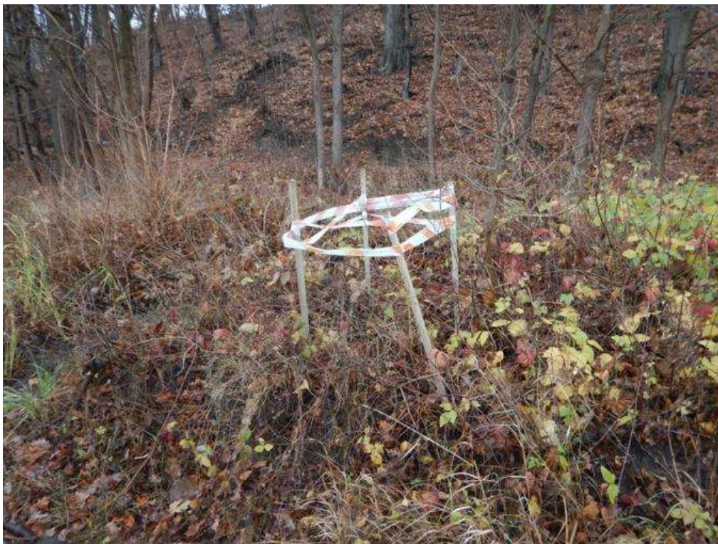
Fot. 3. Zabezpieczone stanowisko wilczomleczka błotnego Euphorbia palustris