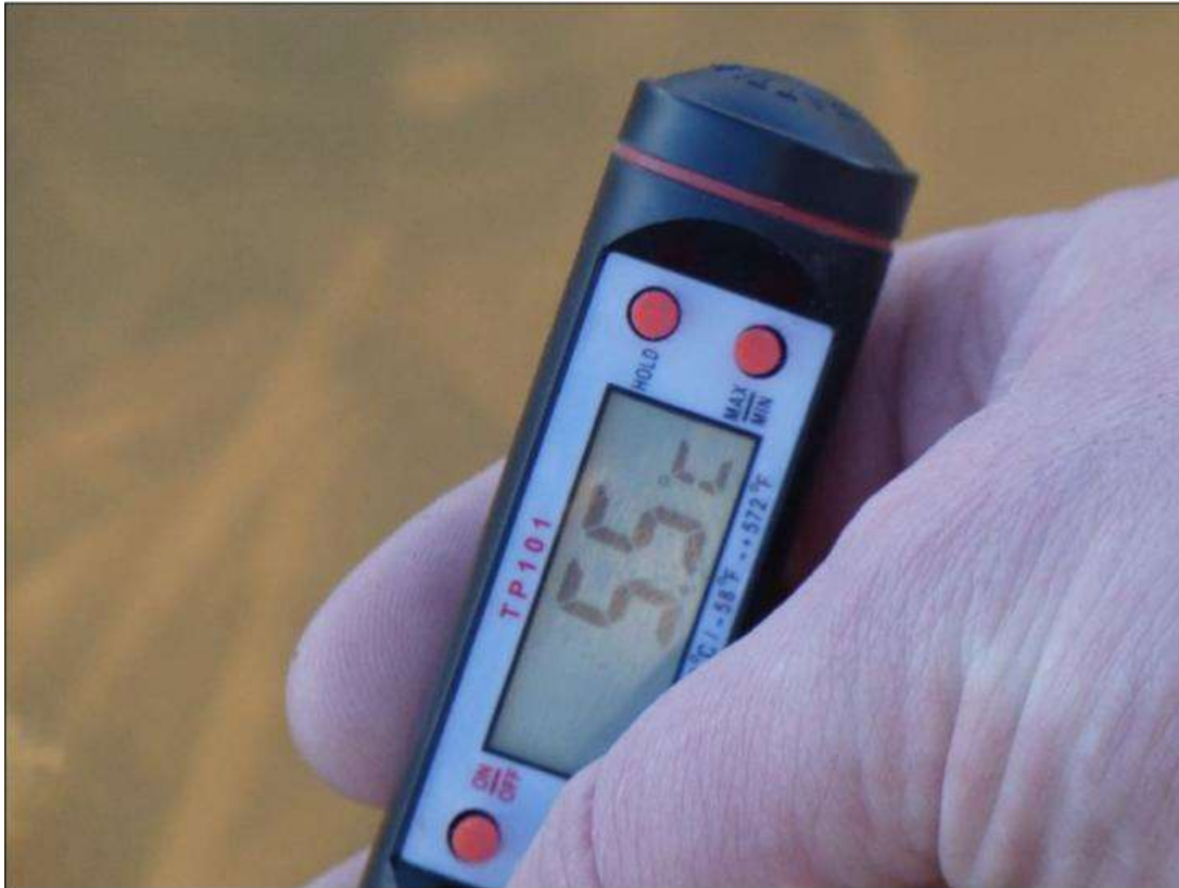
Fot. 13 Przykładowy pomiar temperatury wody – lokalizacja Pławidło