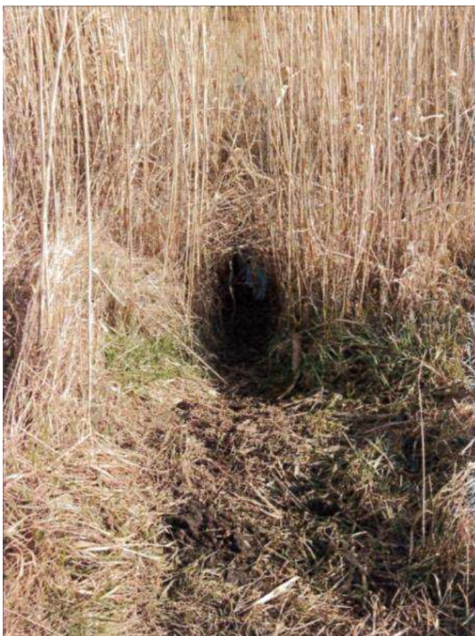
Fot. 16 Ścieżka bobra Castor fiber