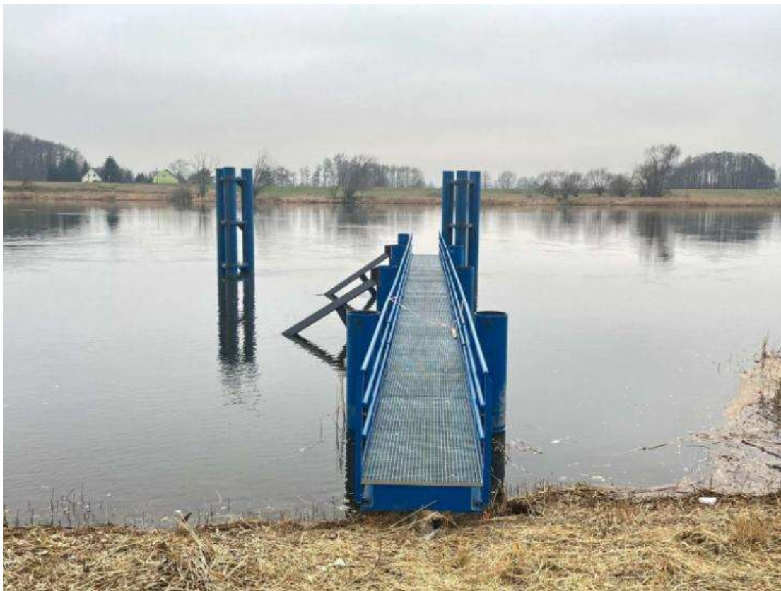
Fot. 11 Zamontowany pomost – lokalizacja Osinów Dolny